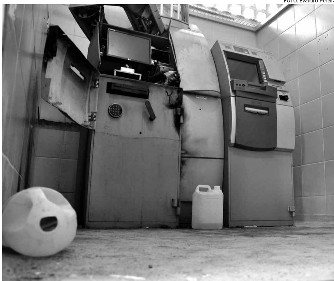
Dados do Sindicato dos Bancários apontam 71 ocorrências de crimes envolvendo bancos este ano

Os três caixas explodidos do Banco do Brasil em Umbuzeiro entram nas estatísticas de crimes bancários como sendo o 71º crime desta natureza na Paraíba em 2013. Informações da polícia dão conta de que por volta das 3h de ontem, cinco homens em um carro importado preto, tipo sedam, explodiram e roubaram o dinheiro de três caixas, que haviam sido abastecidos na segunda-feira.