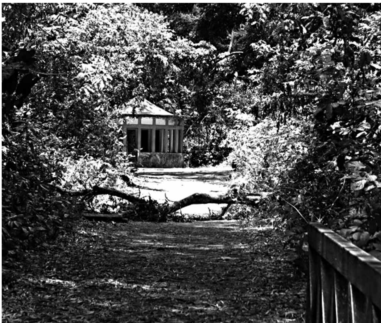
Interior da Mata do Buraquinho. Ao fundo um abrigo de um poço artesiano que em épocas passadas abastecia a capital

Essas áreas nem sempre são compreendidas como um nicho econômico, assim torna-se território para descarte de resíduos, muitas vezes tóxicos, o que acarreta desequilíbrio do ecossistema. "Além do desmatamento nos mangues e áreas de entorno, há a contaminação dos mangues por dejetos e resíduos de produtos utilizados no controle de agentes patológicos que afetam o camarão exótico cultivado nos empreendimentos, provocando desequilíbrio nessas áreas que funcionam como berçários da vida marinha, prejudicando populações de crustáceos, peixes e moluscos, cuja coleta é fonte de renda de milhares de pessoas que vivem nessas áreas", informou Christian Dietrich, da assessoria de comunicação do Ibama na Paraíba.