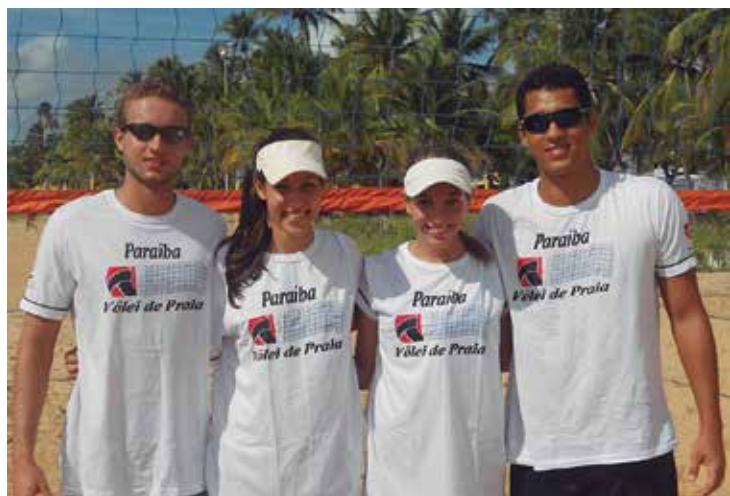
Os paraibanos tiveram o aval da Federação Paraibana de Vôlei

João Pessoa, como uma cidade de grande tradição no vôlei de praia, foi escolhida para sediar a etapa de abertura deste evento que terá seis etapas no decorrer do ano. O Circuito Banco do Brasil Vôlei de Praia Sub-21 terá a parceria do Ministério dos Esportes, e o apoio local da Federação Paraibana de Voleibol, da Prefeitura de João Pessoa e do Governo do Estado da Paraíba.