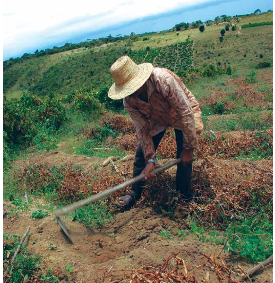
Serão beneficiados mini, pequenos e médios produtores do Nordeste, de Minas Gerais e do Espírito Santo