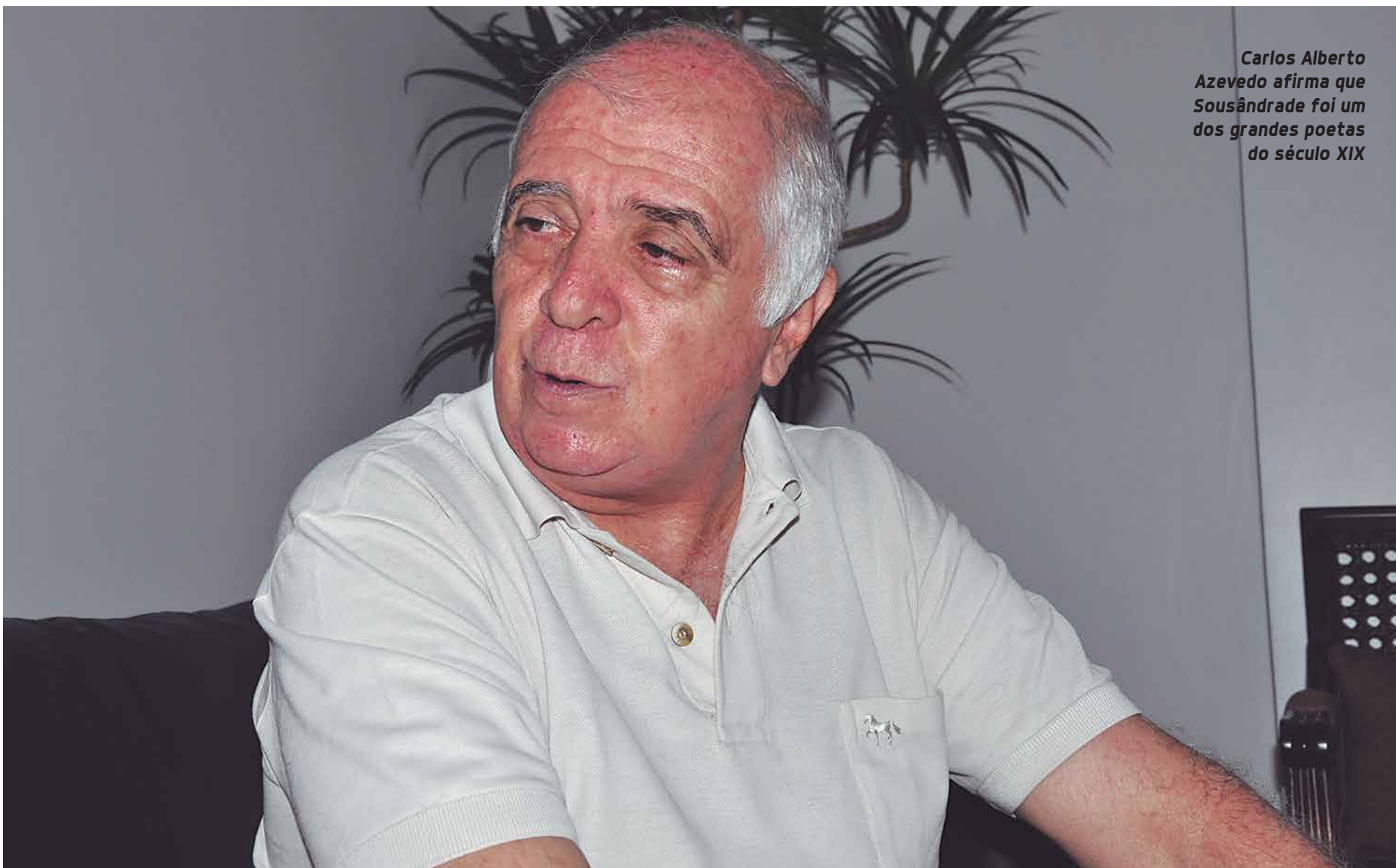
Carlos Alberto Azevedo afirma que Sousândrade foi um dos grandes poetas do século XIX