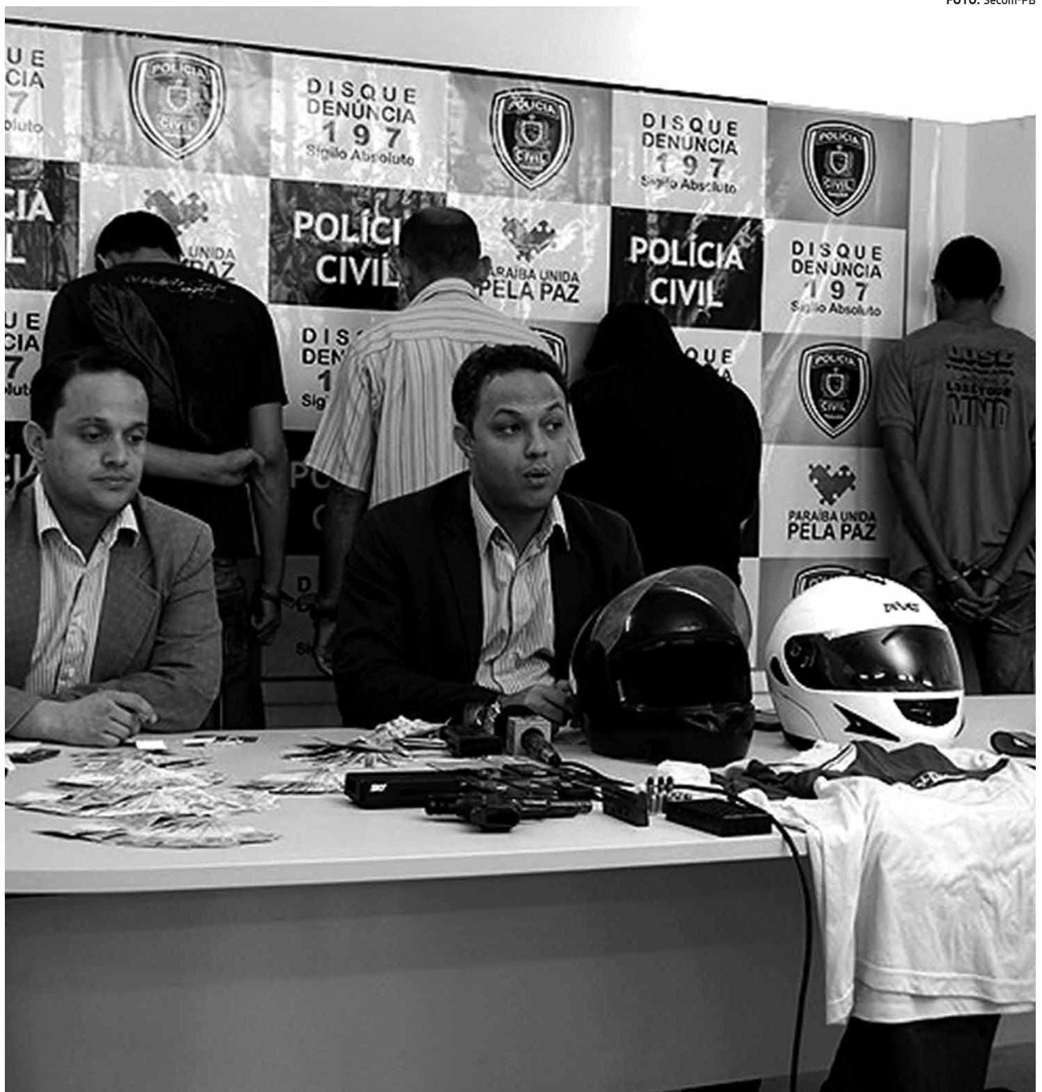
A Polícia Civil apresentou ontem os acusados, além de uma pistola, R$ 4 mil e uma jaqueta de mototaxista apreendidos na operação

A prisão dos assaltantes ocorreu durante abordagem feita por policiais da Delegacia de Roubos e Furtos.