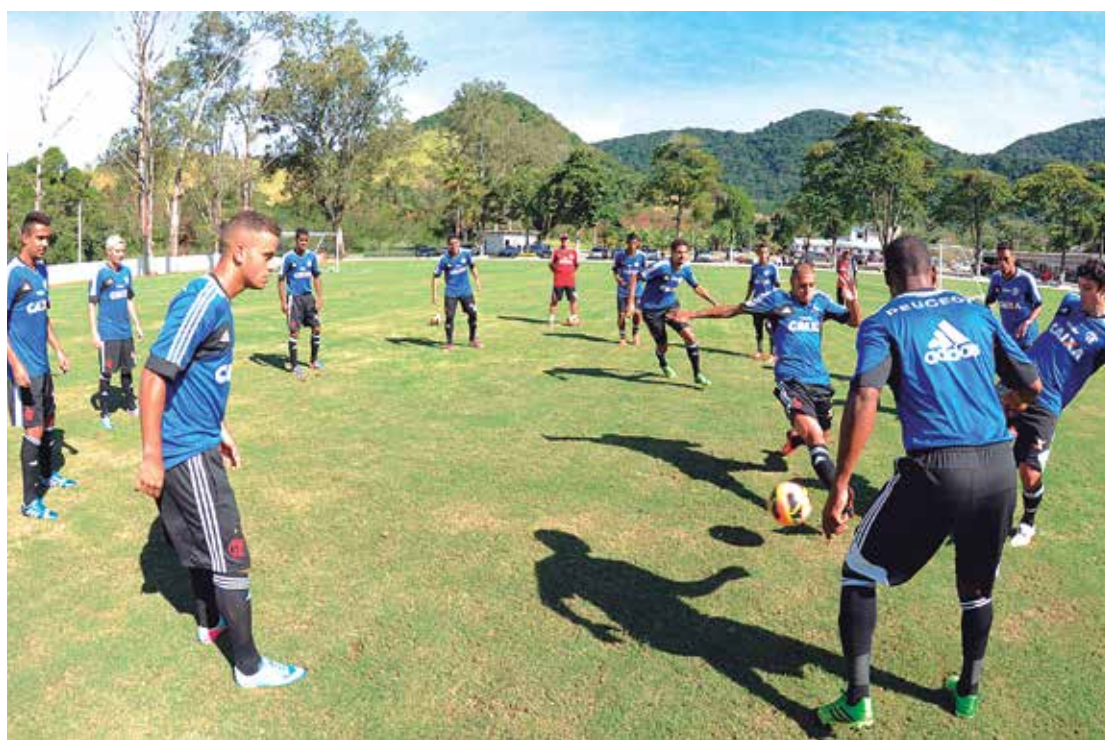
A equipe rubro-negra treinou forte no Ninho do Urubu visando o compromisso de hoje com o Náutico

O amistoso no Maracanã não foi a primeira vez que o ex-jogador do Santos vestiu a camisa 10 pela Amarelinha. Em 2011, no primeiro amistoso antes da Copa América, contra a Alemanha, Neymar também usou tal uniforme. Na ocasião, o Brasil foi derrotado por 3 a 2.