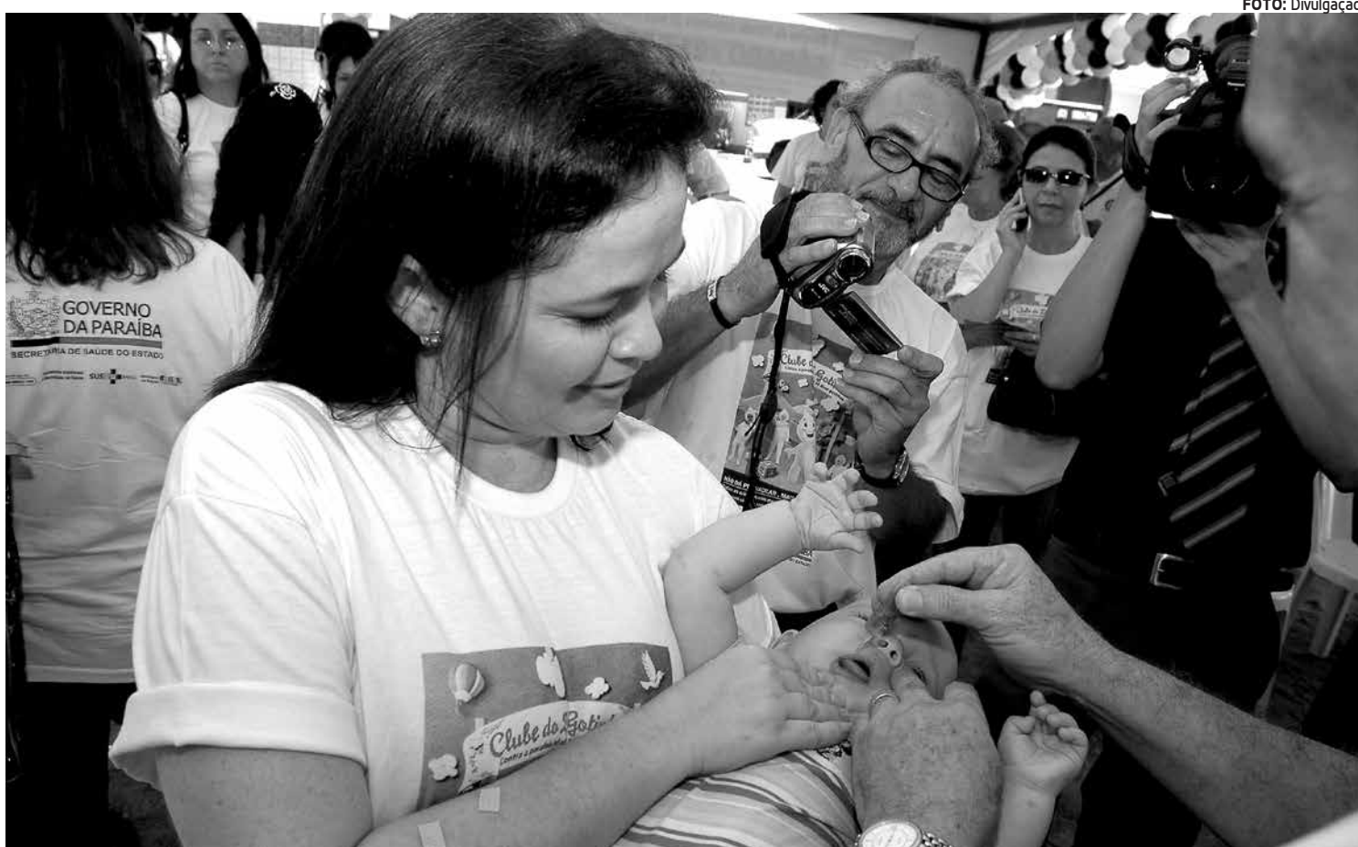
Crianças com idade entre 6 meses e 5 anos podem ser vacinadas contra a pólio, cuja campanha será encerrada no próximo dia 21

Neste ano, o público alvo da campanha da vacina oral são as crianças a partir de 6 meses. Isso porque as crianças menores já estão sendo imunizadas com a dose injetável - introduzida no calendário básico de vacinação no segundo semestre de 2012.