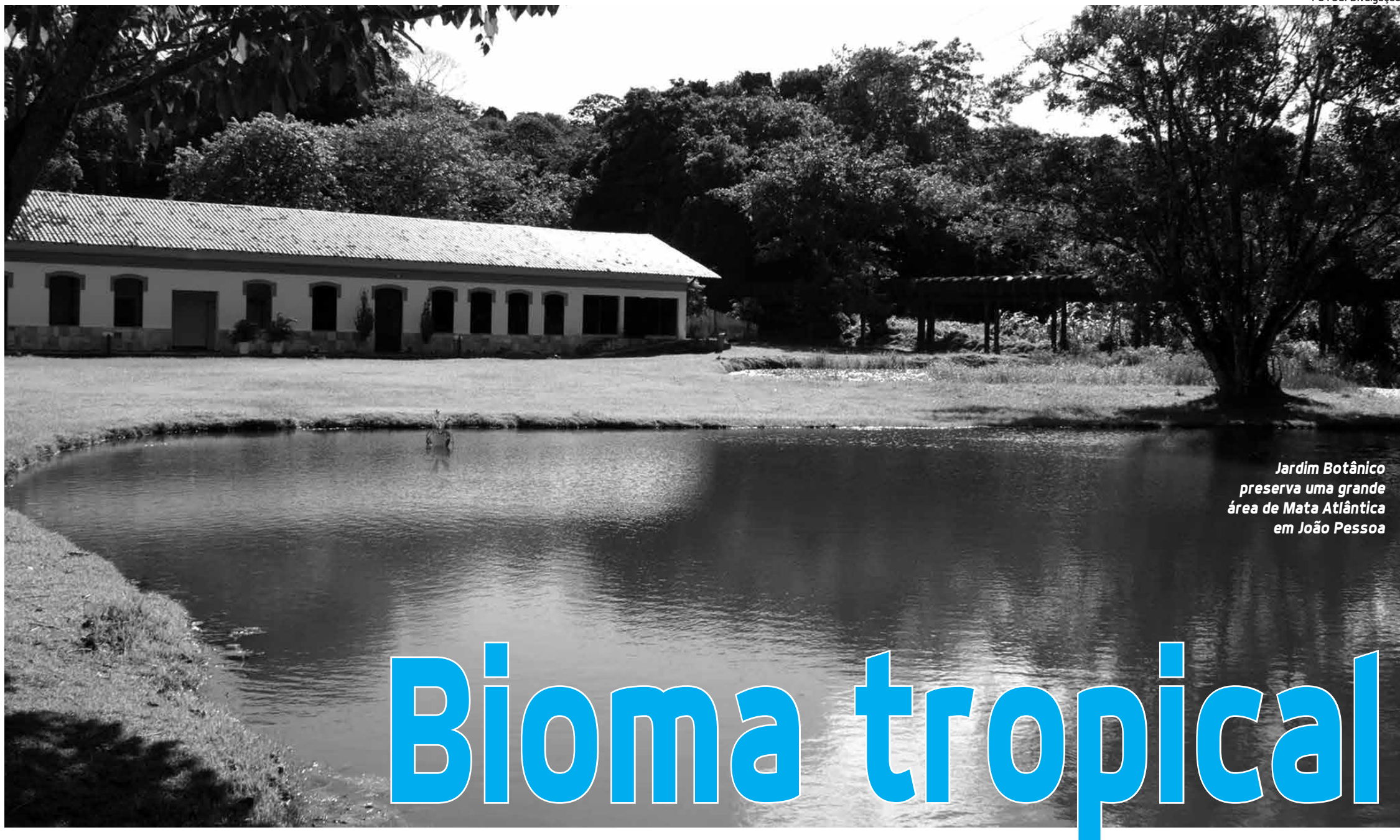
Jardim Botânico preserva uma grande área de Mata Atlântica em João Pessoa