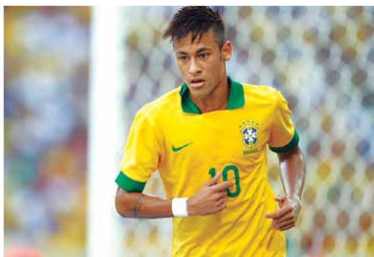
O atacante Neymar, do Barcelona, vestirá a camisa número 10