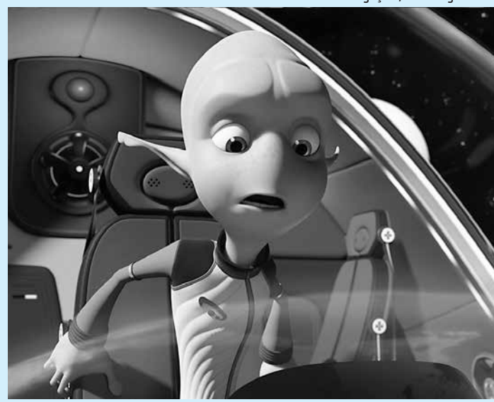
Longa-metragem de animação é feito pelo Blue Sky Studios, o mesmo de Rio